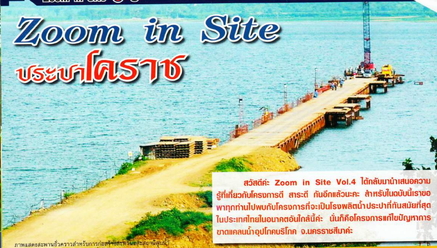
ภาพแสดงสะพานชั่วคราวสำหรับการก่อสร้างสะพานและสถานีสูบน้ำ

สวัสดีค่ะ: Zoom in Site Vol.4 ได้กลับมาเสนอความรู้เกี่ยวกับโครงการดี สารดี กันอีกแล้วนะคะ สำหรับในฉบับนี้เราขอพาทุกท่านไปพบกับโครงการที่จะเป็นโรงผลิตน้ำประปาที่ทันสมัยที่สุดในประเทศไทยในอนาคตอันใกล้นี้ค่ะ นั่นก็คือโครงการแก้ไขปัญหาการขาดแคลนน้ำอุปโภคบริโภค จ.นครราชสีมาค่ะ