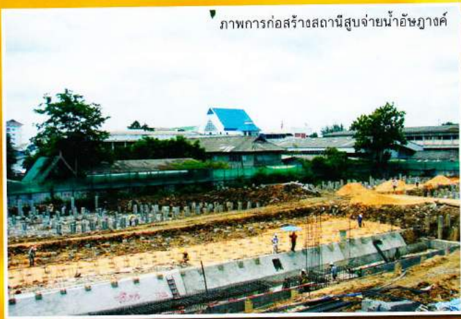
ภาพการก่อสร้างสถานีสูบน้ำจ่ายน้ำอัญญาองค์

สวัสดีค่ะ: Zoom in Site Vol.4 ได้กลับมาเสนอความรู้เกี่ยวกับโครงการดี สารดี กันอีกแล้วนะคะ สำหรับในฉบับนี้เราขอพาทุกท่านไปพบกับโครงการที่จะเป็นโรงผลิตน้ำประปาที่ทันสมัยที่สุดในประเทศไทยในอนาคตอันใกล้นี้ค่ะ นั่นก็คือโครงการแก้ไขปัญหาการขาดแคลนน้ำอุปโภคบริโภค จ.นครราชสีมาค่ะ